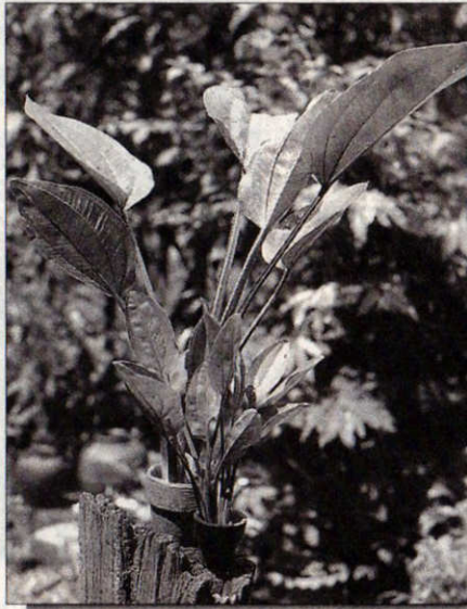
ต้นอะเมซอนใบกลม

“อะเมซอนใบไผ่ นอกจากใส่ในกระถางดินเผาขายเหมือนกับพรรณไม้น้ำอื่น ๆ แล้ว เรายังสามารถขายร่วมกับบอนไม้ได้ด้วยคือ นำต้นไม้มารวมปลูกติดบอนไม้ แล้ววางขายในราคา