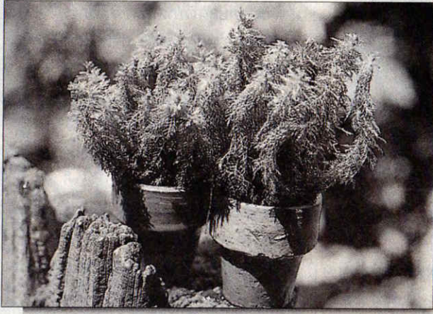
สาหร่ายตัวหนอน

การเก็บเกี่ยวผลผลิตพรรณไม้ในนาเนื้อที่ 6-7 ไร่ นั้น ลุงประจวบและป้ามาลีต้องว่าจ้างแรงงานชาวบ้านถึง 7-8 คน ทั้งนี้ ไม่เพียงคอยเก็บเกี่ยวผลผลิตพรรณไม้ในนาเก็บทุกวัน