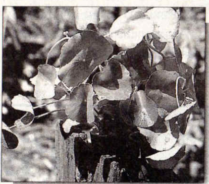
แว่นแก้ว

“ที่ตลาดชั้นดีลูกชายวางขายในช่วงเช้าวันอังคาร พุธ พฤหัสบดี และศุกร์ ส่วนวันเสาร์และ