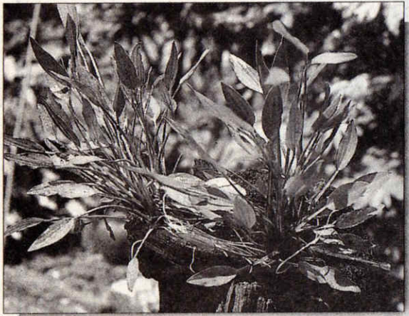
ต้นอะเมซอนใบไผ่

ต้นเทพเกลียวจะเจริญเติบโตอย่างรวดเร็วและออกแขนงไปทั่วทั้งร่องปูนซีเมนต์