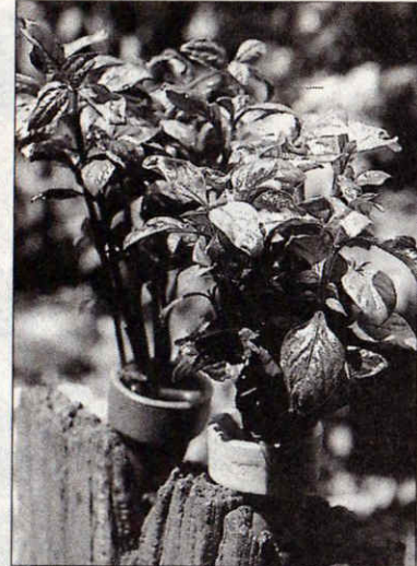
ร่มเชียงใหม่

เธอบอกว่า เมื่อสินค้ามาถึงลูกชายก็เป็นคนขาย เราเป็นเพียงผู้ผลิตเท่านั้น