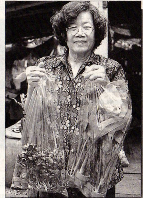
นำพรรณไม้น้ำใส่ถุงพลาสติกเตรียมส่งขาย

สูง ประมาณ 10 เซนติเมตร ซึ่งต้นไม้อาจจะไม่เหี่ยวเฉาตาย แต่ถ้ามีระดับน้ำสูงเกินไป ก็เน่าตายได้เหมือนกัน ดังนั้น เราจะคอยดูตักน้ำเข้า-ออก อยู่ตลอดเวลา คือถ้าวันไหนฝนตกน้ำขังอยู่มาก ก็ต้องคอยดูตักน้ำออก โดยเฉพาะช่วงฤดูฝนที่ผ่านมาเราดูดอกทั้งเกือบทุกวันเลย